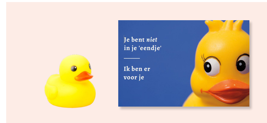
Je bent niet in je een(d)je