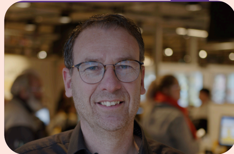
Jumbo supermarkt manager

Er wordt samengewerkt met verschillende bedrijven in de gemeente Terneuzen. Eén van de partijen uit de lokale coalitie is Jumbo Terneuzen. Jumbo opende in 2022 in totaal zo'n 200 klets-kassa's op diverse locaties in Nederland, waaronder één bij een vestiging in Terneuzen. De klets-kassa is bedoeld voor klanten die geen haast hebben en behoefte hebben aan een praatje. Caissières van locatie Terneuzen hebben een training gevolgd in het herkennen van eenzaamheid.